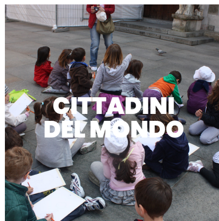
CITTADINI DEL MONDO